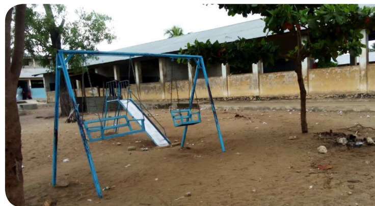
Vifaa vya michezo katika shule ya serikali ilioko Unguja (Magharibi)

Kutokana na uzoefu, utaalumu, na mamlaka yao, watekelezaji wakuu wa mradi wa Watoto Kwanza – AKF, MECP-Z na WEMA – wana nafasi nzuri ya kuipeleka mbele sekta ya Elimu ya Maandalizi, ili iwe bora na endelevu hapa Zanzibar.